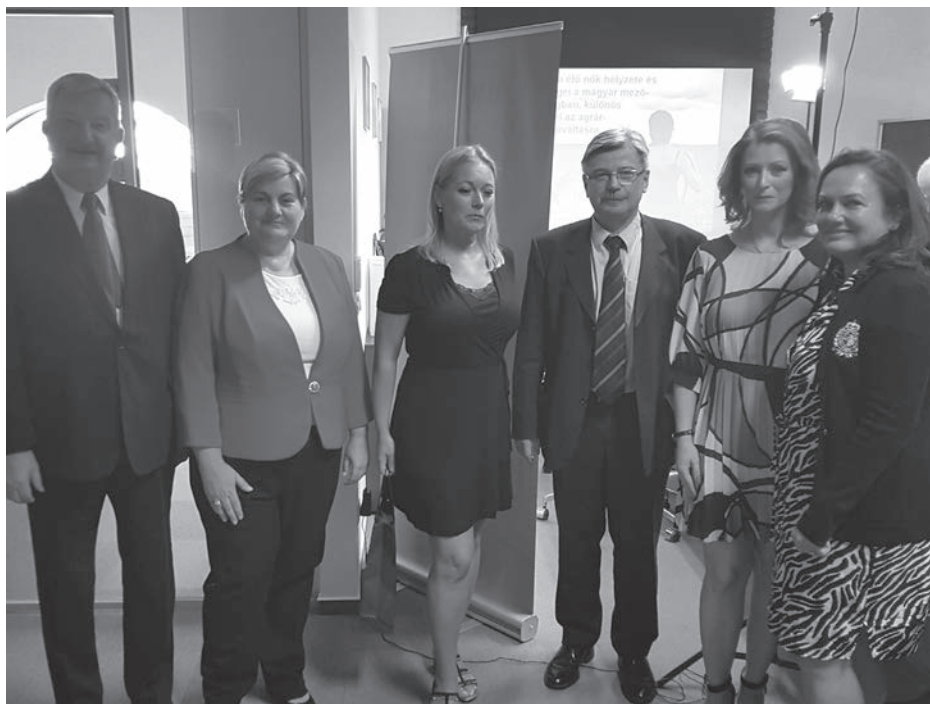
A kerekasztal-beszélgetés résztvevői

Mint a bevezető gondolatok sorában említettük, az 58. közigazgatás vándorgyűlés agráriumot érintő teljes anyaga továbbra is elérhető és megtekinthető a megadott linken. Javasoljuk, hogy kattintsanak rá és ismerjék meg a hozzászólók részletes érvelését. Bízunk benne, hogy munkánk tovább erősíti szakosztályunk tevékenysége utáni érdeklődést, ahová továbbra is szeretettel várjuk minden érdeklődő jelentkezését.